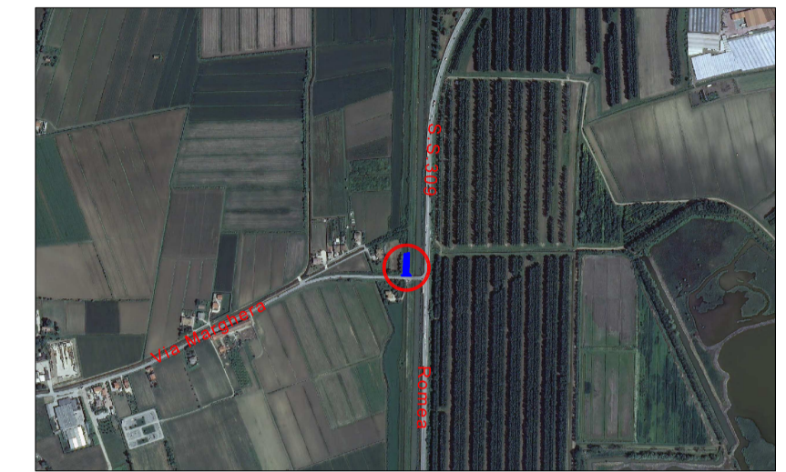
FOTOPIANO AREA INTERVENTI