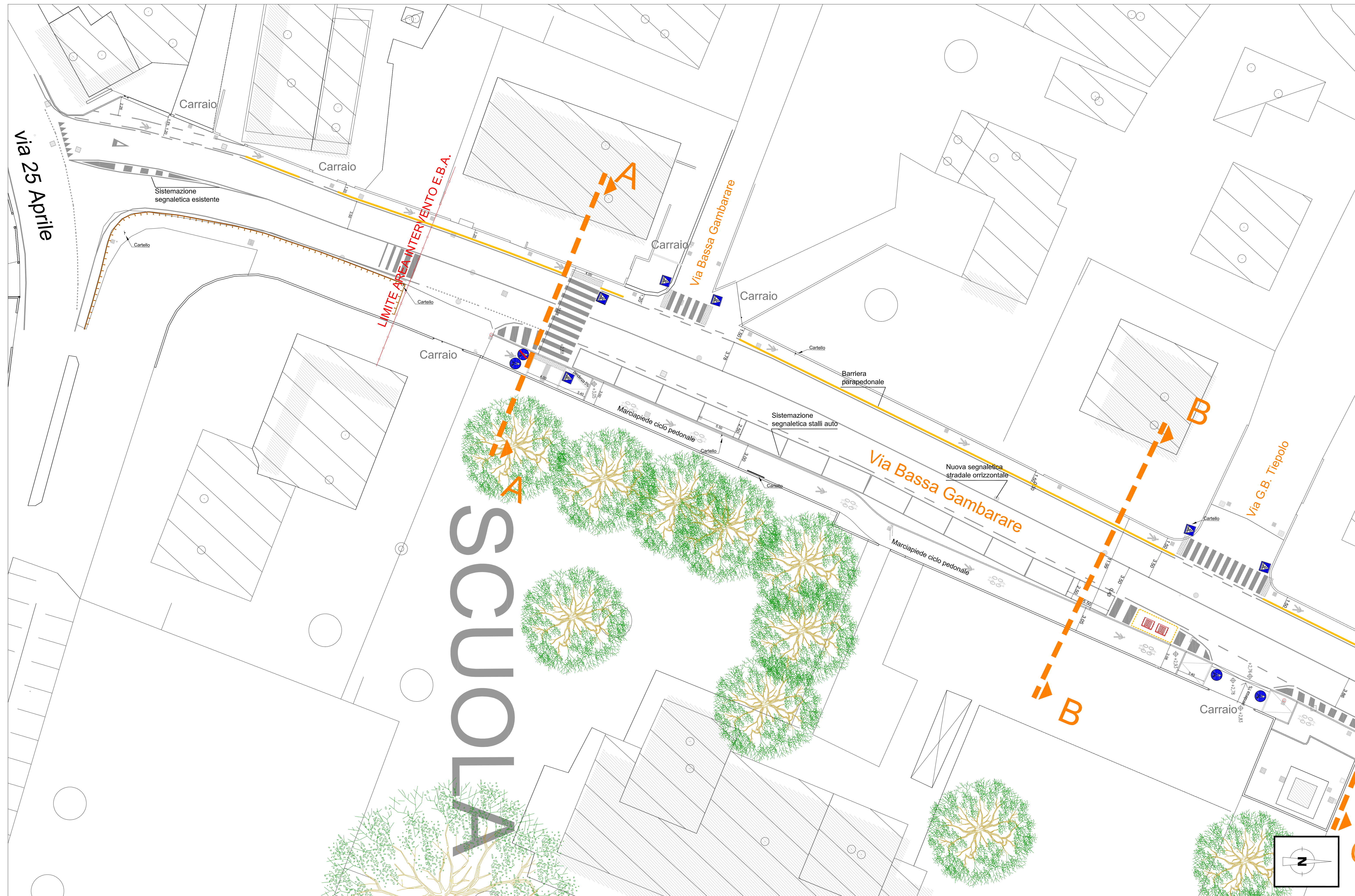
PLANIMETRIA STATO DI FATTO - LOTTO 1 scala 1:200